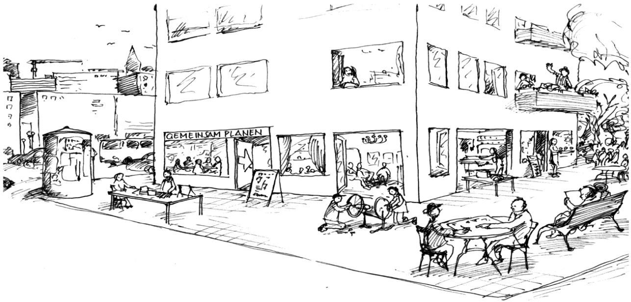
Abb. 1: Grafik Hamann, Hörster, Rohr 2018, S. 55

nicht konturscharf benennen, weil die Einzelakteure selbst „viele Hüte“ tragen und sich vielmals in unterschiedlichen Rollen und Funktionen wiederfinden. In der Gesamtschau zeigt sich hier ein kreatives und kompetentes Gestaltungspotential, das vielerorts auch vice versa seitens Politik und Verwaltung gezielt und selbstverständlich als „Impulsgeber“ für eine moderne Stadtentwicklung wahrgenommen und in Teilen auch bereits als solche gefördert wird (vgl. Ring et al. 2013, Ferguson/Urban Drift Projects 2014). Urbane Festivals wie Make City, Creative Bureaucracy, die Experimentdays, Urbanize, die Raumkonferenz oder der Tag des guten Lebens haben sich zu entsprechenden Inkubatoren eines solchen Stadtentwicklungsverständnisses entwickelt, bei dem es um partnerschaftliche kooperative bzw. kollaborative Lösungsansätze zwischen Stadtmacherinnen und Stadtmachern, Zivilgesellschaft, Politik, Verwaltung und wirtschaftlichen Akteuren geht.