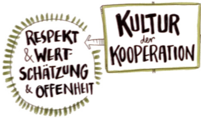
Abb. 2: Augenhöhe ist beim Stadtmachen nicht immer selbstverständlich, Grafik: Kellner 2018

Sinne eines entsprechenden Wissensmanagements auf kommunaler wie auch auf interkommunaler Ebene. Es gibt jedoch bereits erste Ansätze, um hier Abhilfe zu schaffen. Zum Beispiel zielt der Bundespreis kooperative Stadt darauf ab ( https://koop-stadt.de ), und auch auf Seiten der Stadtmacherinnen und Stadtmacher gibt es diesbezüglich Handlungsvorschläge: So wurde im Kontext der Ko-Forschung der Urbanen Liga ( https://urbane-liga.de ) der „Kodex Kooperative Stadt“ formuliert, der Konturen eines „Code of Conduct“ gelingender Kooperationen zwischen stadtgestaltenden Initiativen und etablierten Stadtentwicklungsakteuren benennt. Dazu zählt allem voran die Anerkennung von Stadtmacherinnen und Stadtmachern als legitime Kooperationspartner der Stadtentwicklung; gleichzeitig werden spezifische organisatorische Optimierungsmöglichkeiten in der Zusammenarbeit mit der Verwaltung benannt, wie etwa beim Nutzungszugang für Räumlichkeiten, der Zugänglichkeit von Informationen über im Grundbuch eingetragene Eigentumsverhältnisse bzw. verlässlicher Fördermittel für soziokulturelle Aktivitäten des Stadtmachens.