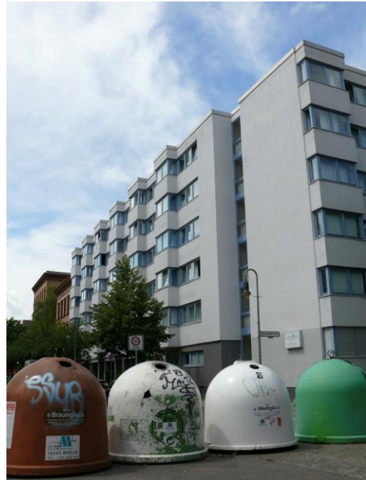
Marginalisiertes Quartier „Brunnenviertel“ in Berlin-Wedding, Foto: © Olaf Schnur

Marginalisierte Quartiere: In diesen Verliererzonen der Globalisierung sind insbesondere drei Gruppen auf das Quartiersumfeld als Ressource angewiesen: zugewanderte, arme bzw. arbeitslose und alte Menschen. Abhängig von deren Lebenslage, d. h. deren Einkommens-, Bildungs- oder Teilhabe-Chancen sowie vom Lebenszyklus, in dessen Phasen wir unterschiedlich mobil sind, werden Angebote aus dem Quartier – von kommunaler Infrastruktur