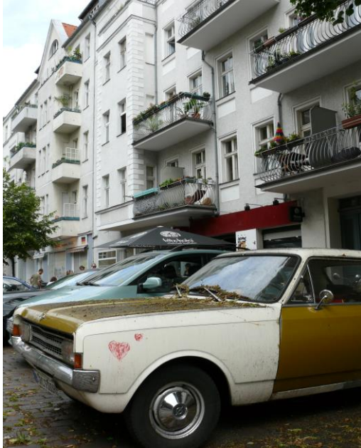
Kreativquartier „Kreuzkölln“ in Berlin

genannt werden, auf eine plurale Bewohnerschaft mit experimentellen, auch postmaterialistischen Lebensstilen. Häufig verschmelzen Wohnen und Arbeit im Quartiersalltag, was in kreativen Berufen oft als konstitutiv angesehen wird. Nicht selten stellen solche „Kreativquartiere“ genau die Zonen der Stadt dar, in denen Aufwertungs- und Verdrängungsprozesse stattfinden.