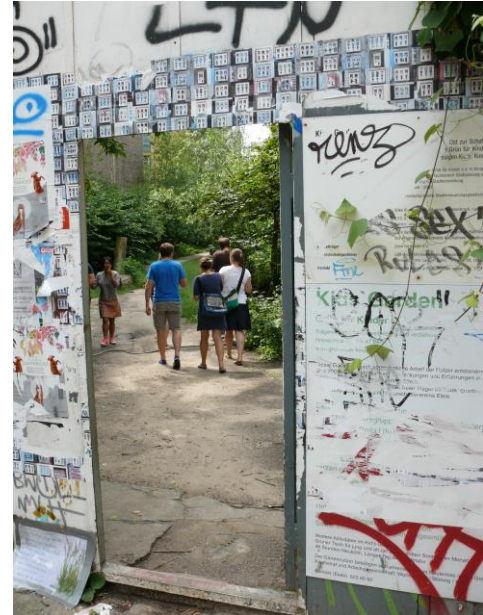
Nachbarschaftsgärten in „Kreuzkölln“ (Berlin), Foto: © Olaf Schnur

Wir können festhalten: Es existiert eine bunte, anspruchsvolle und praxisrelevante Forschungskulisse in verschiedenen Disziplinen mit einer enormen diskursiven Vielfalt. Daraus