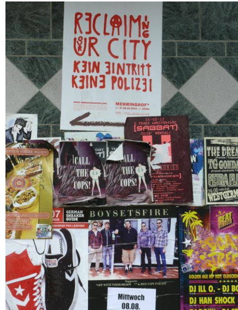
„Reclaiming our city!“ – Recht auf Stadt, Berlin-Kreuzberg, Foto: © Olaf Schnur

In der wissenschaftlichen Literatur wird dies von vielen Autoren als Übergang von einer „fordistischen“ zu einer „postfordistischen“ politisch-ökonomischen Konstellation gedeutet – also als die Auswirkungen der ökonomischen Globalisierung und der damit verbundenen, tendenziell an Kapitalinteressen ausgerichteten Politikformen. Betrachtet man parallel dazu gesellschaftlich-kulturelle Entwicklungen, so stellt man – im analogen Übergang von der Moderne zur Postmoderne – nicht nur eine Restrukturierung herkömmlicher Ökonomien und Politiken, sondern auch eine Auflösung traditioneller Lebens- und Haushaltsformen sowie eine Ausdifferenzierung neuer Lebensstile fest. Die soziale Polarisierung und Diversifizierung schlägt sich auch räumlich nieder und dies insbesondere in Großstädten, was sich als Segregation und Fragmentierung