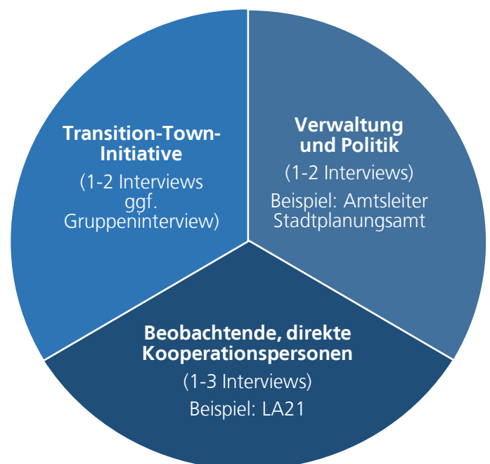
Abbildung 3: Akteursgruppen/Interview-Konstellation

Die Interviews wurden als leitfadengestützte persönliche Gespräche geführt, die idealerweise mit einer Begehung von Aktionsräumen der TTI vor Ort verbunden waren. Die Gespräche