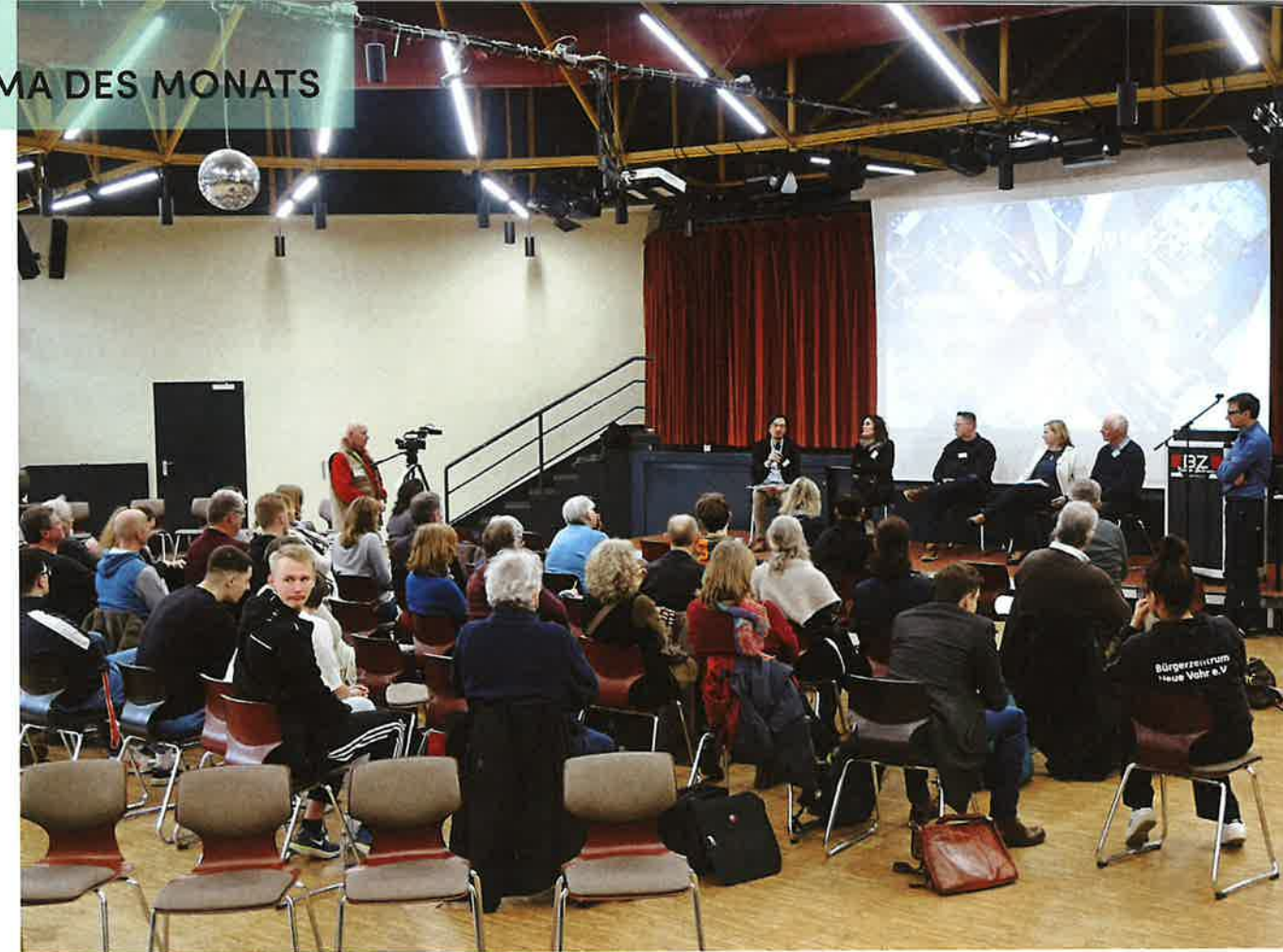
Im „Bildungsdialog Bremen-Neue Vahr“ werden die Möglichkeiten zur Weiterentwicklung der Bildungslandschaft im Quartier ausgelotet und diskutiert

Diese Stiftung ermöglicht mit ihren finanziellen Mitteln die Umsetzung von schulischen Projekten, für die im öffentlichen Bildungsetat keine Mittel vorgesehen sind. So konnten bisher über 1.000 Projekte gefördert werden. Es wurden zum Beispiel Musikinstrumente, Laborausstattung, EDV-, Spiel- und Sportgeräte finanziert, im Ausnahmefall auch mal ein Therapie-Pferd.