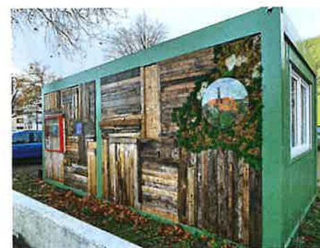
Ein Container bietet dem Projekt „Creative Spaces“ einen Raum zur kreativen Entfaltung

lichen Start-ups wird hier die Angebotsvielfalt für den Stadtteil ergänzt.